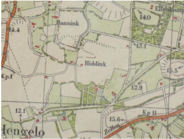
Topografische kaart 1926

De functie laan staat tevens vermeld op het kadastraal minuutplan uit 1832, eveneens voor de bouw van het buiten 5 . Belangrijk detail is dat de oude bosvijver eveneens al zichtbaar is op deze kaart. Waarmee de laan en de bosvijver de oudste parkelementen vormen op het buiten. Wanneer we met grote sprongen door de ontwikkelingsgeschiedenis van Het Regelink gaan 6 zien we als laatste fase van belang de verkoop van het buiten in 1926.