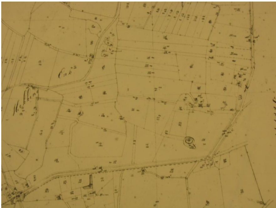
Kadastraal minuutplan 1832